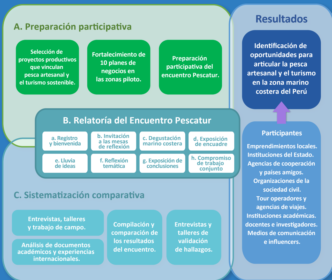
Diagrama de metodología para identificar oportunidades para articular la pesca artesanal y el turismo sostenible

Para registrar perspectivas y puntos de vista de los diferentes actores que inciden en la articulación de la pesca y el turismo partiendo de diversos ámbitos y sectores, desde quienes participan en la formulación, publicación y gestión de políticas públicas, hasta los pobladores locales, se utilizaron distintos enfoques metodológicos que permitieron identificar las oportunidades para articular la pesca artesanal y el turismo en la zona marino costera del Perú.